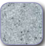
*grau multicolor glimmering