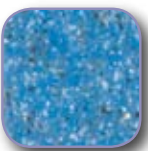
*blau multicolor glimmering