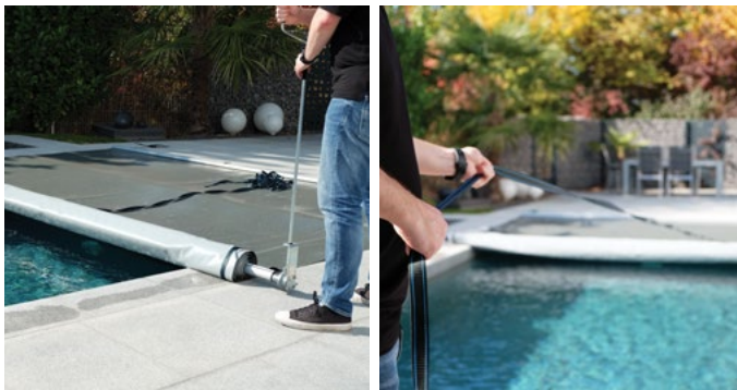
Aufrollen mit Handkurbel