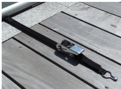
Edelstahlratsche mit Gurt und Ring (seitlich und in der Tiefe verstellbar)