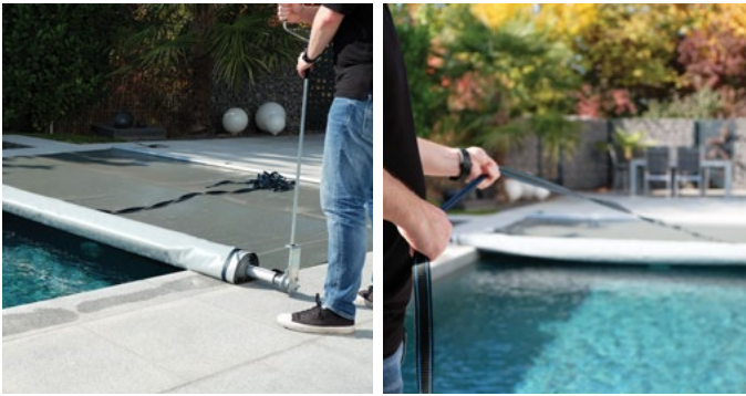
Aufrollen mit Handkurbel